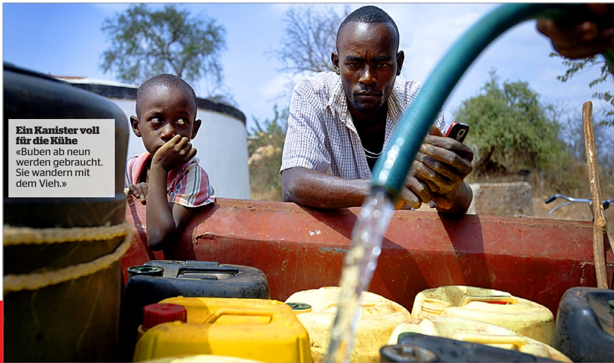
Ein Kanister voll für die Kühe «Buben ab neun werden gebraucht. Sie wandern mit dem Vieh.»