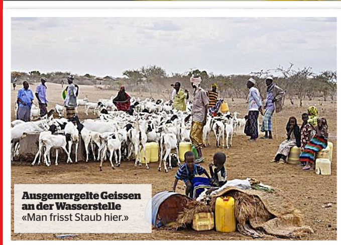
Ausgemergelte Geissen an der Wasserstelle «Man frisst Staub hier.»